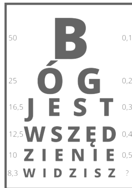
Obrazek z 23.03.2014