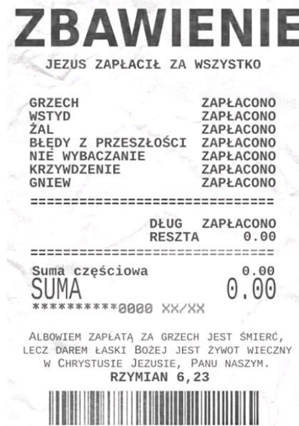
Obrazek z 19.12.2021